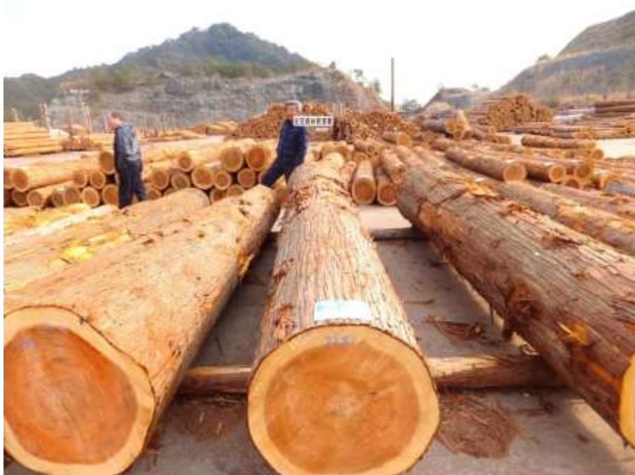
上の写真: ゲンボク市場(高知市)