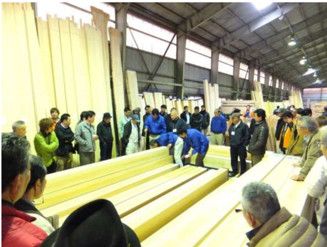
優良土佐材見本市(高幡木材センター)四万十町窪川 2015.2